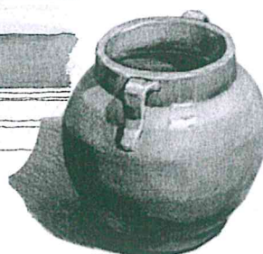
Laboratorio di Ceramica