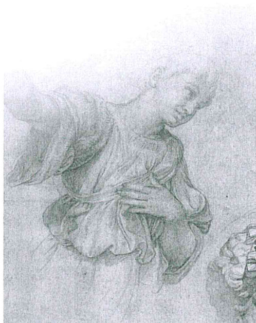
Laboratorio di Arti Figurative