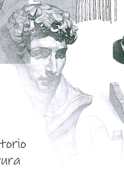
Laboratorio di Scultura